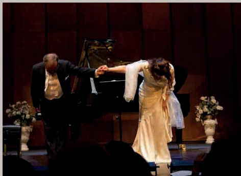
LIEDERABENDE mit Bezug zur Natur