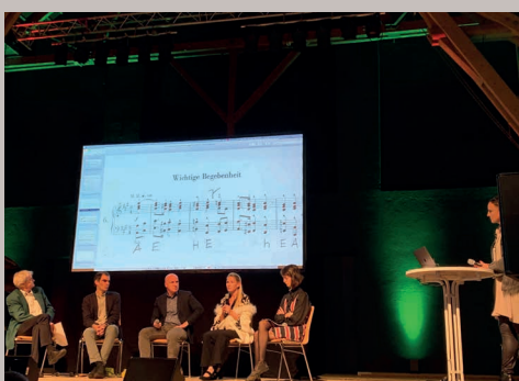
SYMPOSIEN PODIUM & PUBLIKUM zu Themen zwischen Natur und Musik