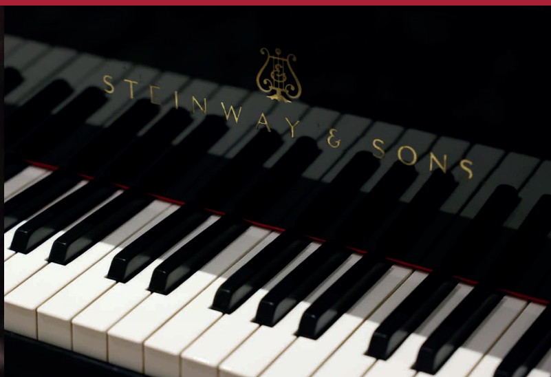
Die Pianistinnen spielen auf einem Steinway-Konzertflügel D-274

Bitte beachten Sie auch die weiteren Informationen auf den folgenden Seiten dieses 20-seitigen PDF-Dokuments.