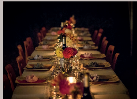
EXQUISITE MUSIK-DINNER mit führenden Musikern