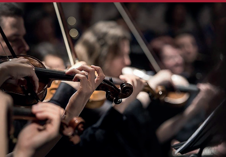
Junges Philharmonisches Orchester München