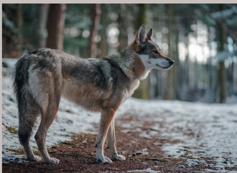
ARTENSCHUTZTAGE Wölfe (USA), Elefanten, Wald