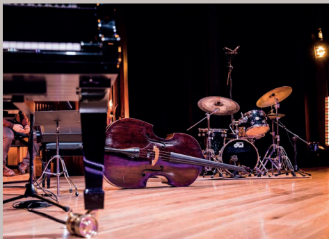
KLAVIERKONZERTE mit Orchester