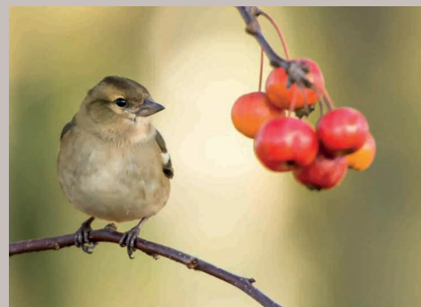
ARTENSCHUTZPROJEKTE auch Fundraising