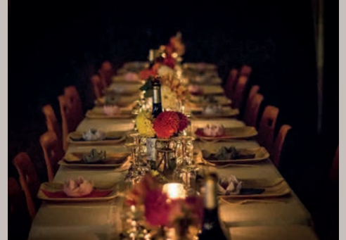
EXQUISITE MUSIK-DINNER mit führenden Musikern