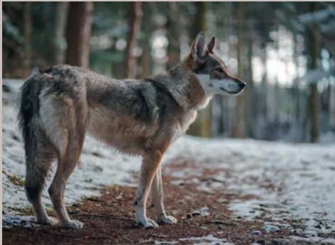
ARTENSCHUTZTAGE Wölfe (USA), Elefanten, Wald