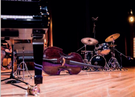
KLAVIERKONZERTE mit Orchester