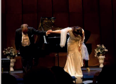
LIEDERABENDE mit Bezug zur Natur