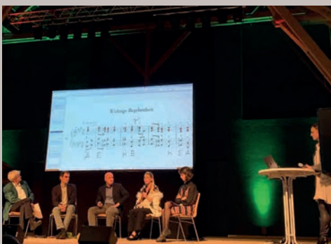
SYMPOSIEN PODIUM & PUBLIKUM zu Themen zwischen Natur und Musik