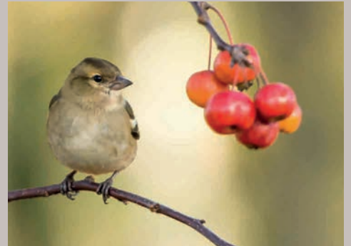
ARTENSCHUTZPROJEKTE auch Fundraising